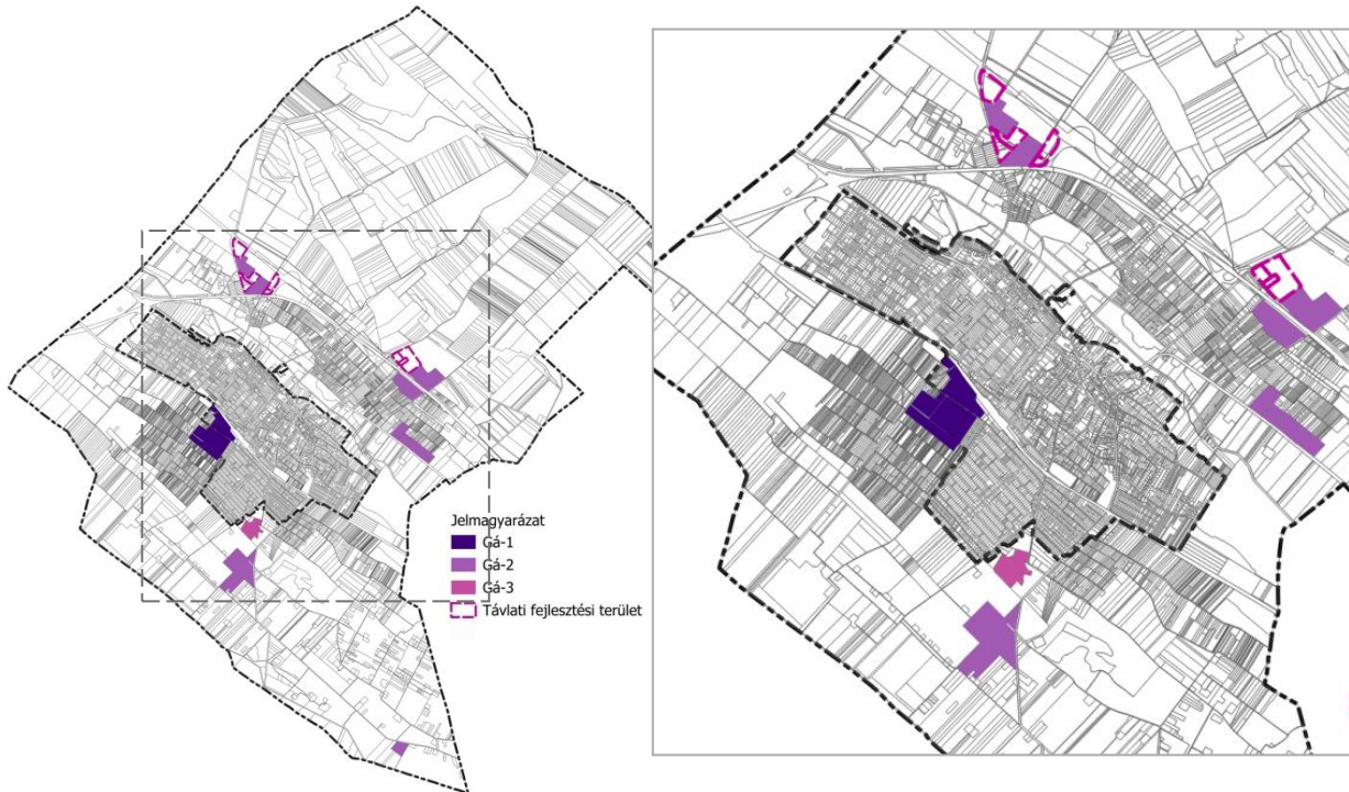
Az érintett általános gazdasági területek építési övezeteinek elhelyezkedése

A hatályos településrendezési eszközök a módosítással érintett területeket általános gazdasági területként, Gá-1, Gá-2 és Gá-3 építési övezetbe sorolják, illetve ide tartoznak még ezeken kívül a távlati fejlesztési terület, melyeken a helyi építési szabályzat építési jogot nem keletkeztet, Má-1 övezetbe sorolt ingatlanok. A távlati fejlesztési területeket a módosítás nem befolyásolja.