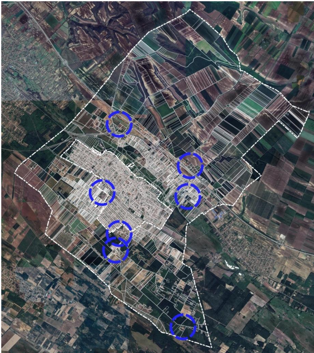
Az érintett általános gazdasági területek építési övezeteinek elhelyezkedése a településen

A módosítással érintett általános gazdasági területek jellemzően a település belterületétől északra és délre elszórtan helyezkednek el. Ezen területek jelentős részén található beépítés melyeket jellemzően szántó területek vesznek körül. Az itt található épületek főként gazdasági létesítmények. Továbbá az M4-es autópálya mentén a 0117/12-14 és 0117/17-18 hrsz-ú telkeken naplempark található.