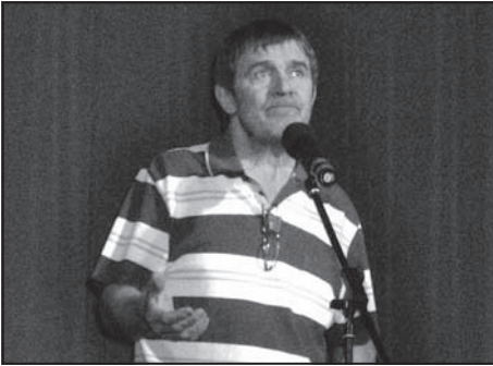
A humor nagyggyúii a Sportsarnokért: 11. oldal