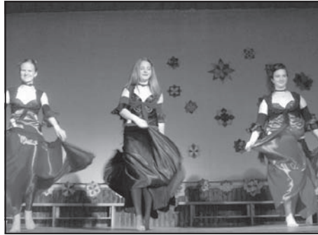
Stiluskavalkád a Múvelődési Házban: 8. oldal