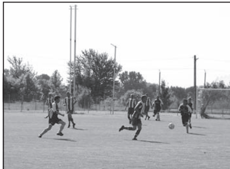
Sportsikerek – 22. oldal