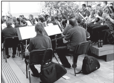
Gerje-Party sikerek – 6. oldal